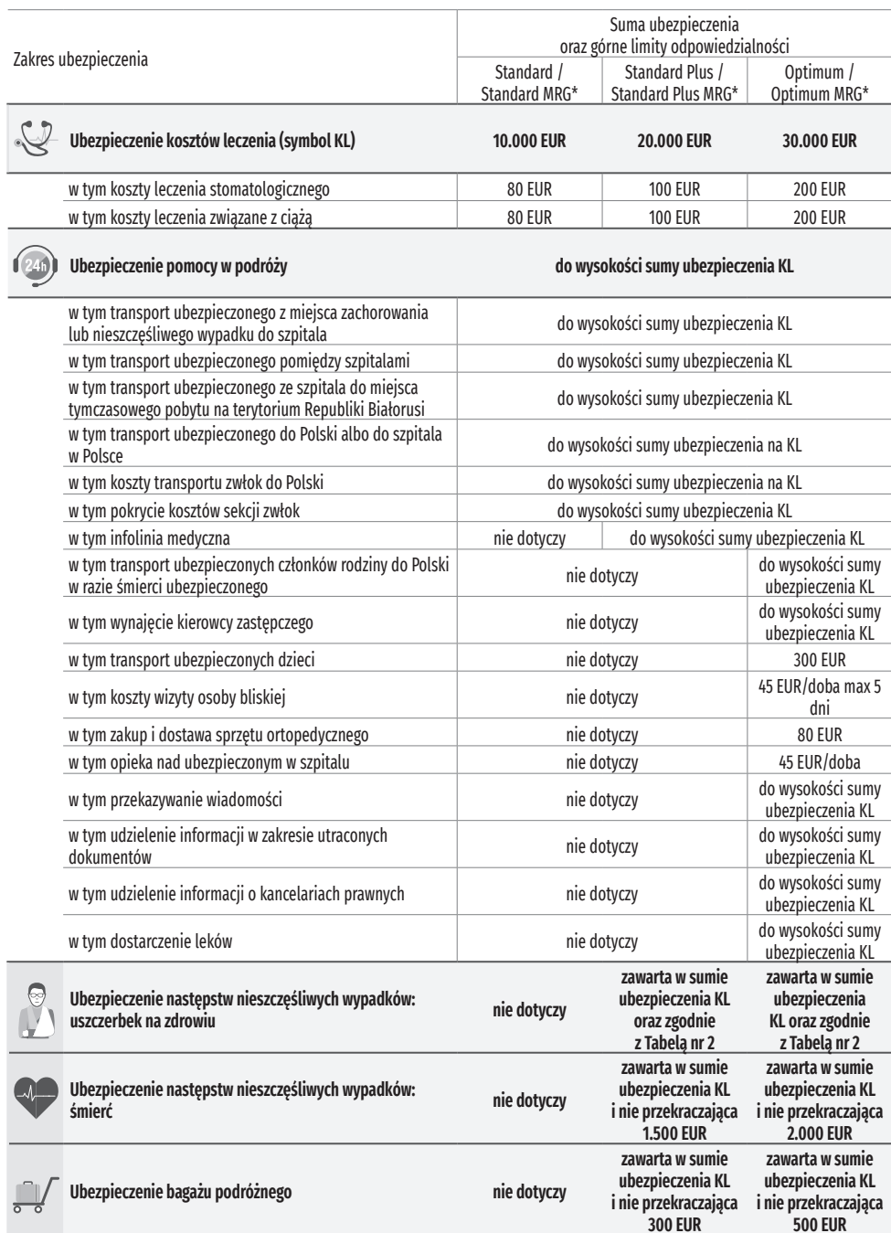
➤ Tabela nr 1